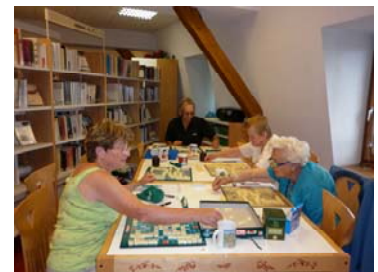
Scrabbleurs en pleine action !