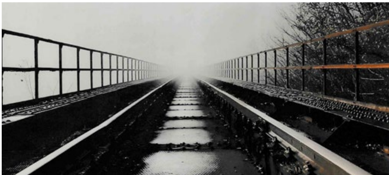
Le 2 nd prix est attribué à M. Zbinden.