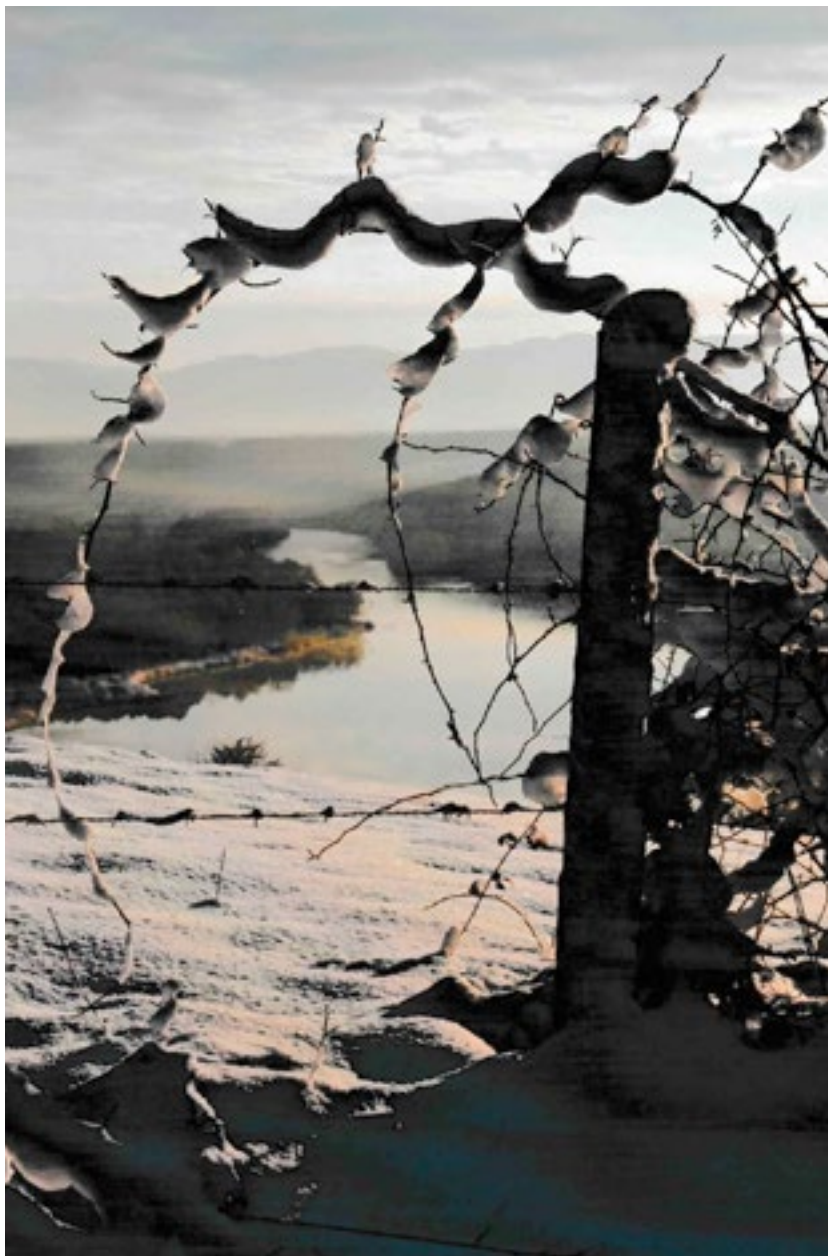
Le 1 er prix est attribué à Mme Sorglius.

Vos élus ont décidé d'attribuer une dotation totale de 300€ aux heureux gagnants. Les 5 chanceux se verront attribuer des bons d'achat à consommer chez les commerçants de Collonges. Ils seront valables jusqu'à fin juin 2021 et permettront ainsi de découvrir ou redécouvrir les commerces du village. Nous remercions par avance nos commerçants pour l'accueil qu'ils réserveront aux lauréats.