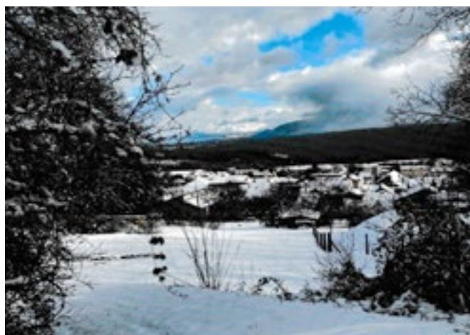
Le 5 ème prix est attribué à Melle Rivollier.

Nous vous invitons à découvrir toutes les photos participantes pendant ces mois de printemps puisqu'elles sont exposées dans la vitrine de l'ancienne Superette située Grand rue (à côté de la Mairie).