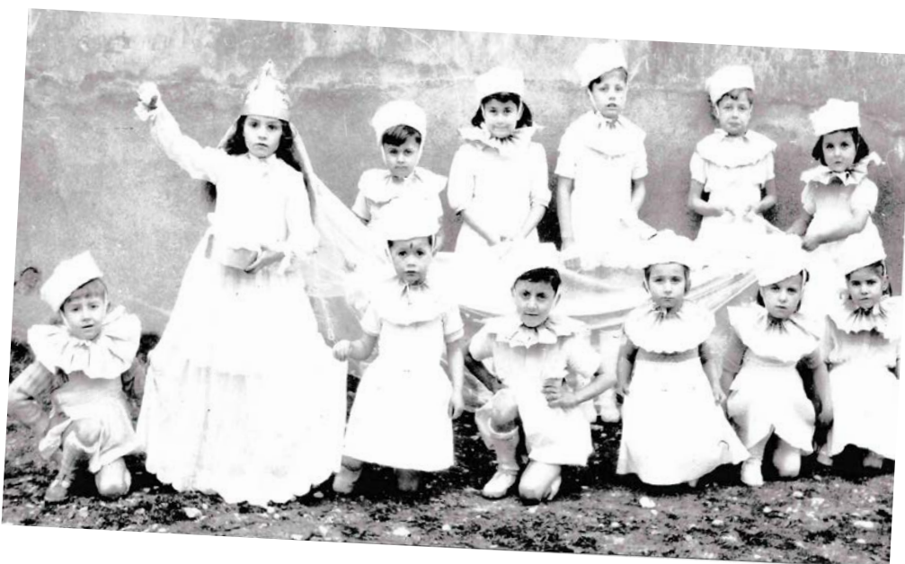
Photo Reine des neiges, Noël 1947