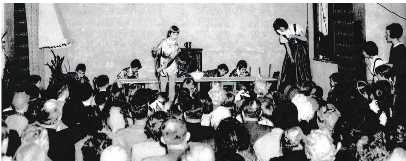
Photo Blanche Neige et les 7 nains Noël 1955