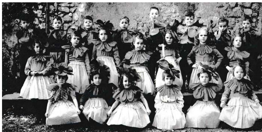
Photo les Coquelicots Noël 1954