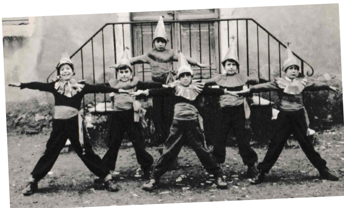
Photo 1 Spectacle école 1947 ou 1948